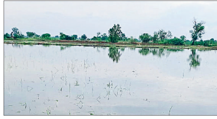
झज्जर। निकासी व्यवस्था न होने के कारण खेतों में भरा बरसाती पानी।