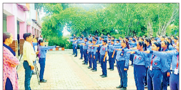
झज्जर। नशे से दूरी बनाए रखने की शपथ लेते हुए विद्यार्थी।