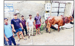
झज्जर। घायल गोवंश के साथ उपस्थित गौरक्षा दल के सदस्य।