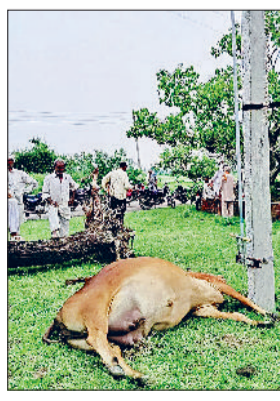
झज्जर। करंट की चपेट में आई गाय की मौत के बाद घटनास्थल पर एकत्रित ग्रामीण।