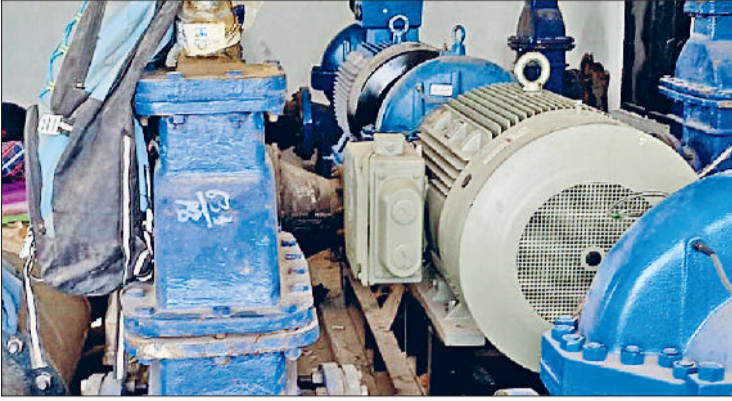
झज्जर। बुकनवाली पंप हाउस पर पानी निकासी के लिए लगाई गई मोटर पर चढ़ी धूल