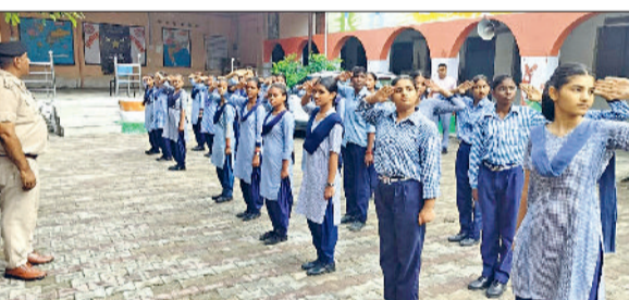
झज्जर। एसपीसी के तहत छात्रों को दिया प्रशिक्षण।